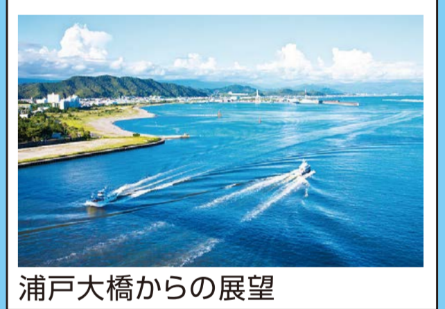
浦戸大橋からの展望