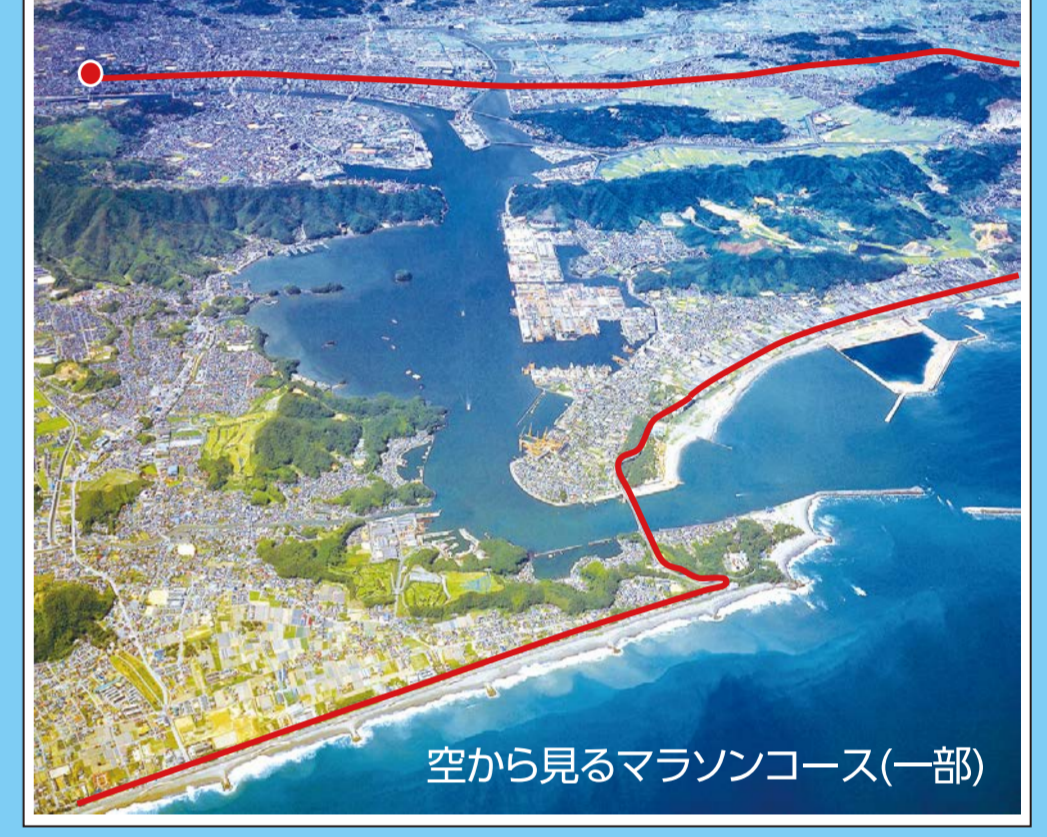
空から見るマラソンコース(一部)