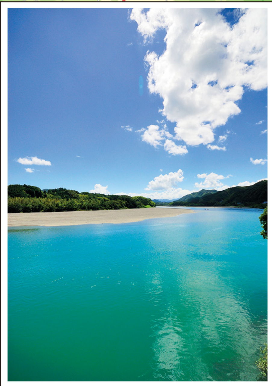
奇跡の清流 仁淀川