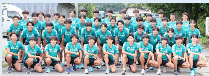
青山学院大学陸上競技部

第100回箱根駅伝（2024年）で大会新記録をマークし、7回目の総合優勝を果たす。高知龍馬マラソン2025では全国で初めてペースランナーとして参加。